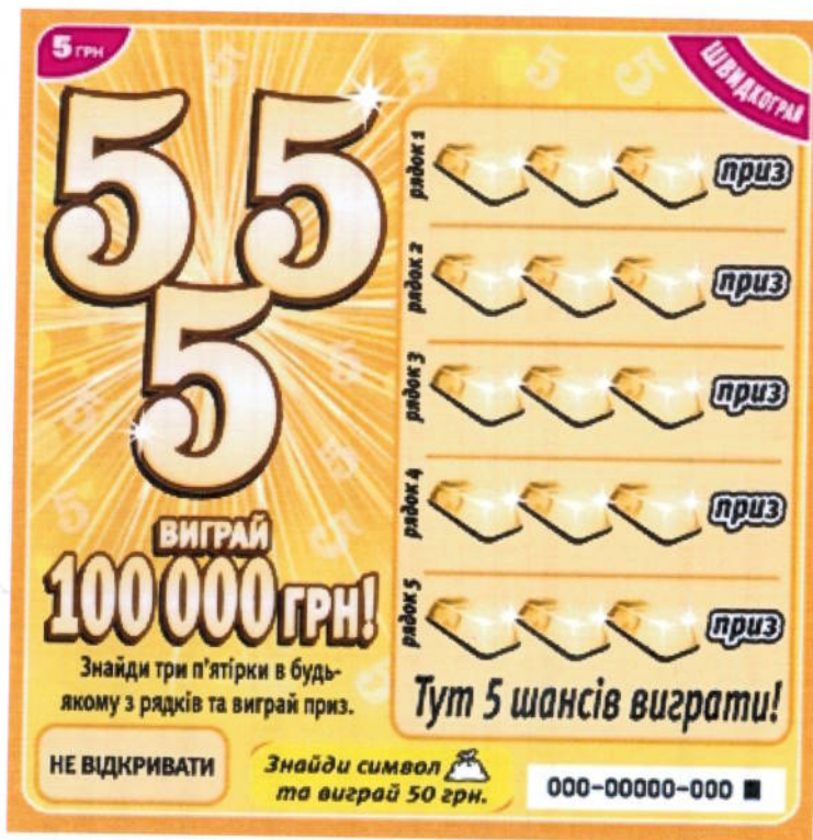
Макет білета державної грошової миттєвої лотереї «Три п'ятірки»*