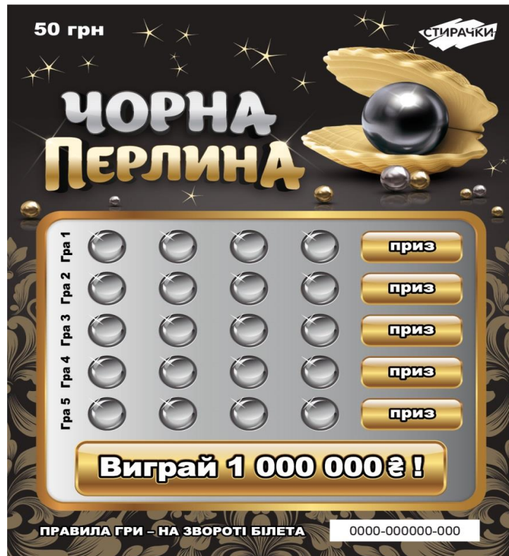
Лицьова сторона лотерейного білета