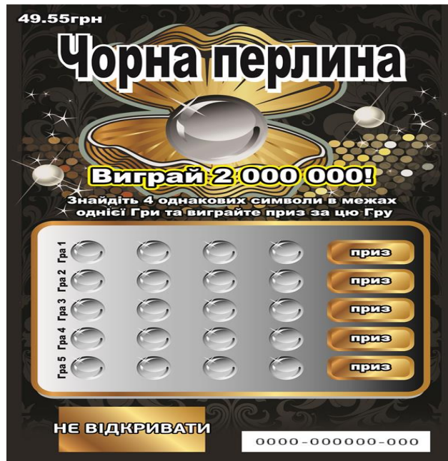
Лицьова сторона лотерейного білета