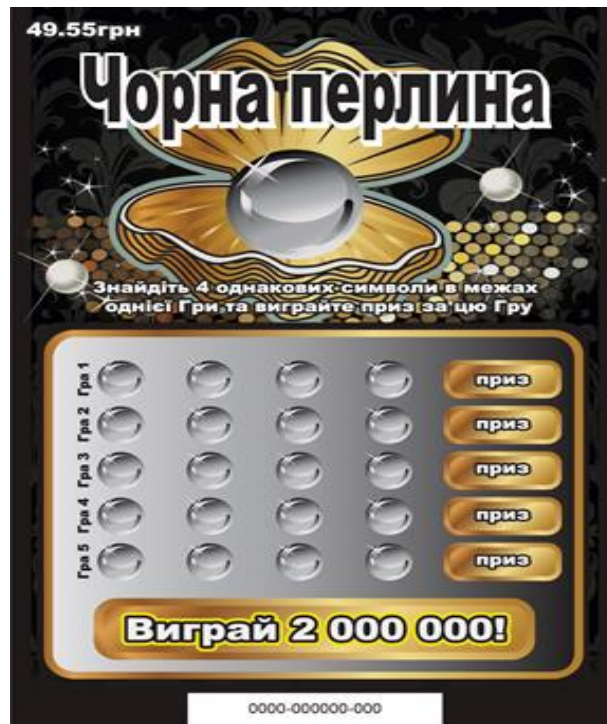
Лицьова сторона лотерейного білета