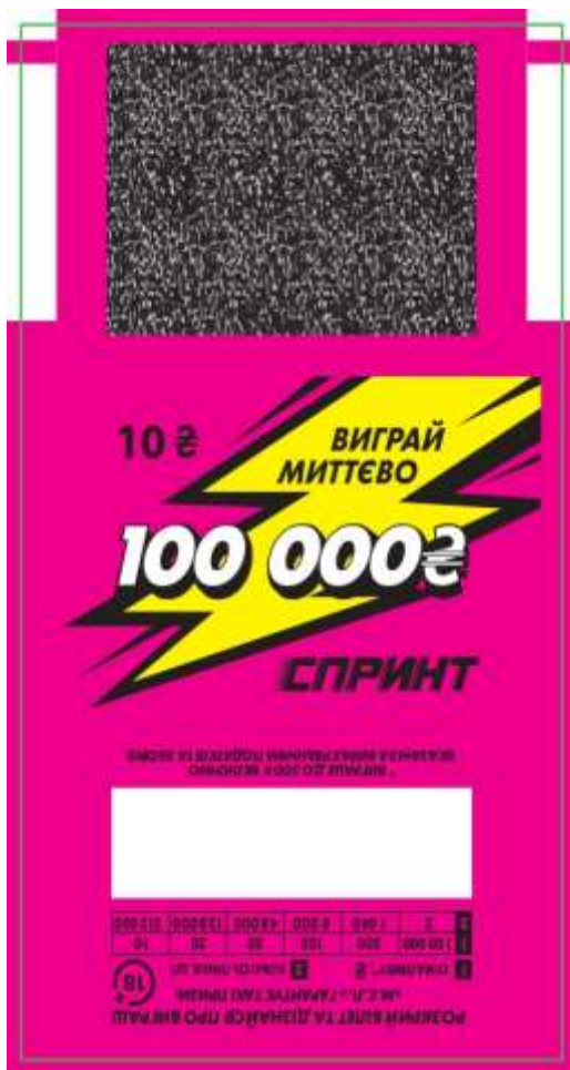
МАКЕТ зовнішнього розвороту білета